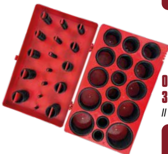
O-Ring Sortiment, 419-teilig 3-50mm