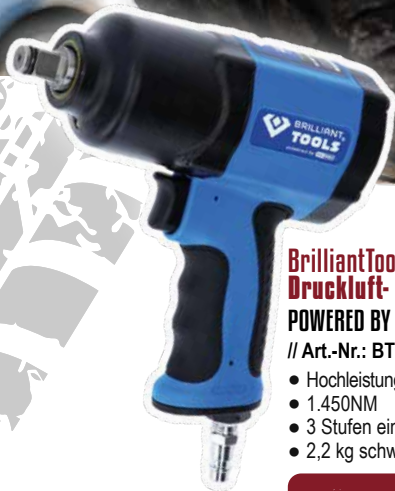
BrilliantTools Druckluft- Schlagschrauber POWERED BY KS TOOLS