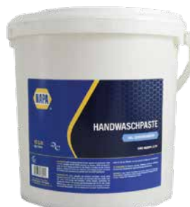
Handwaschpaste 10L Eimer