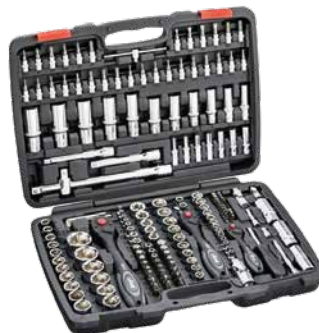
Vigor Steckschlüsselsatz 172-teilig / POWERED BY HAZET