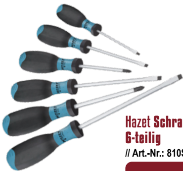
Hazet Schraubendrehersatz 6-teilig